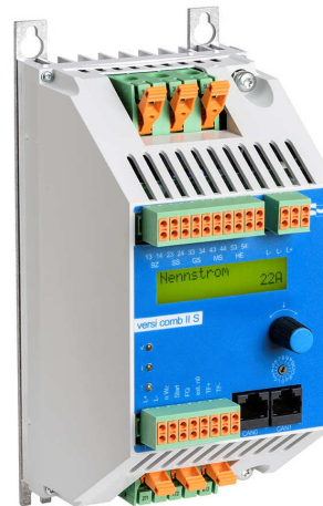
Motorstart-Bremsskombination VC II S 575 – 12 ... 60 CE c UL US LISTED